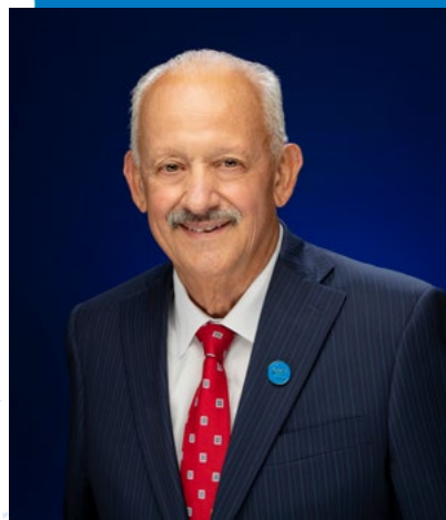
Tomás D. Morales Presidente

Es un privilegio para mí darles la bienvenida a los padres, familiares y seres queridos de los estudiante que cursan su primer año en la Universidad Estatal de California, San Bernardino. Somos una institución donde los estudiantes amplían sus horizontes educativos y personales a medida que buscan definir su futuro.